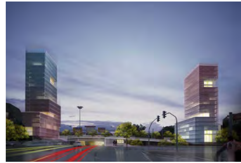
Tower Ost und West mit Promenadendeck