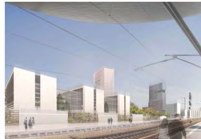
ICE-City aus Blickrichtung Erfurter Hauptbahnhof