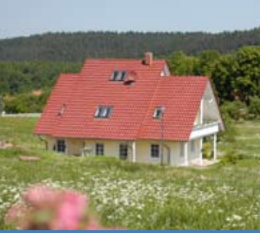
Verbunden mit der Natur in Catterfeld.