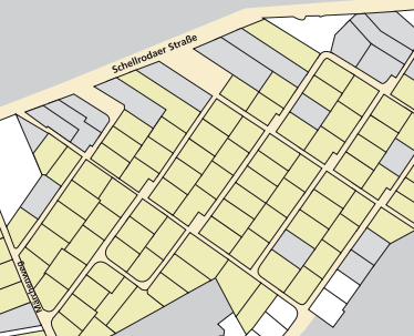
Parzellierungsplan in Erfurt - Windischholzhäusen.