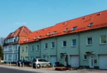
Wohnen im Stadtgebiet von Gotha.