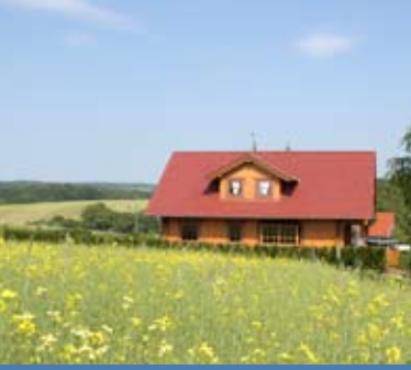
Ruhig und idyllisch leben in Ballstädt.