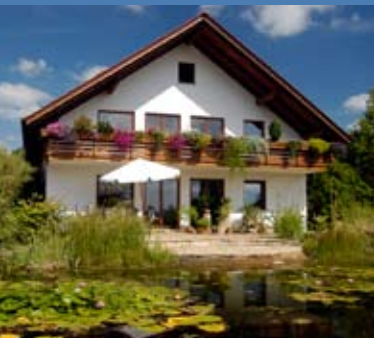
Viel Platz zum Wohnen in Creuzburg.