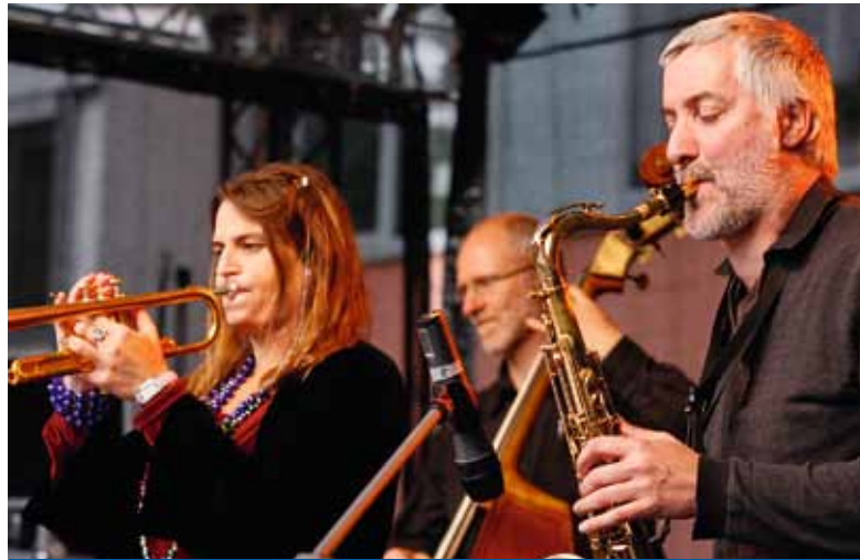
Dans le cadre du 17 e festival de jazz Thüringer Jazzmeile, plus de 150 concerts rassemblant des musiciens du monde entier ont eu lieu dans 18 villes de Thuringe, permettant des échanges culturels au-delà des frontières.

A ce moment de l'année, le vent d'automne balaie avec vigueur les rues et routes de Thuringe. Dans son sillage, le jazz. Mais autant le vent est fort, autant le jazz est léger et gai. C'est l'antidote idéal contre la mélancolie automnale et les mauvaises vibrations. Car la seule chose qui résonne actuellement en Thuringe ces temps-ci, c'est le son du piano, de la contrebasse et des cymbales, autant d'instruments invités au 17 e festival Thüringer Jazzmeile. Tout a commencé en 1994, grâce à l'engagement de musiciens à Weimar et Iéna. Puis, au fil des ans, le festival s'est largement établi sur la scène musicale. Chaque année, le festival attire des milliers d'amoureux de la musique «faite main» qui se retrouvent dans les clubs de jazz du land. En l'an 20 de l'Allemagne réunifiée, 18 villes de Thuringe célèbrent avec plus de 150 concerts rassemblant des musiciens du monde entier les échanges culturels au-delà des frontières. L'événement est placé sous le signe de «Borderhopping – Innen-Außenansichten» (Perspectives intérieures et extérieures): du 3 octobre au 25 novembre, les sons et les mélodies de jazz parcourent la région, de Sonneberg à Nordhausen, en passant par Weimar, Altenburg,