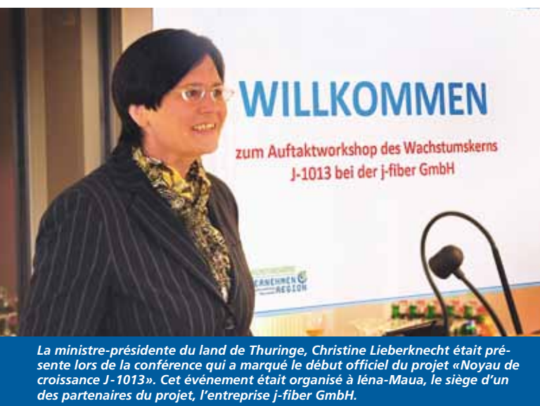
La ministre-présidente du land de Thuringe, Christine Lieberknecht était présente lors de la conférence qui a marqué le début officiel du projet «Noyau de croissance J-1013». Cet événement était organisé à Iéna-Maua, le siège d'un des partenaires du projet, l'entreprise j-fiber GmbH.

Quasiment tous les secteurs de l'industrie dans le monde entier bénéficient des Innovations dans le domaine de la technologie de surface. Qu'il s'agisse de technique aéronautique ou de navigation