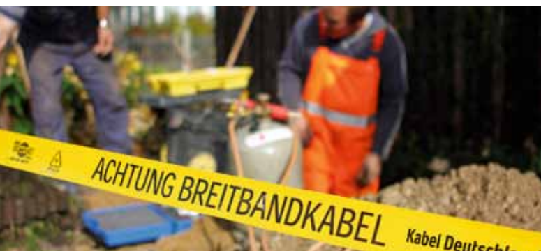
Attention travaux: Afin qu'à l'avenir tous les clients du fournisseur puissent avoir accès à un réseau performant de télévision, téléphone et internet large bande, une grande partie des branchements télé doit être modernisée dans toute l'Allemagne.

Pour réserver ses vacances par internet, faire son shopping ou effectuer ses opérations bancaires en ligne, il est très conseillé d'avoir une connexion à