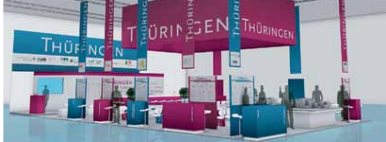
Un stand de 209 m 2 pour la Thuringe: cette année encore, le ministère thuringien de l'Économie et la Société de Développement de la Thuringe étaient représentées à Expo Real avec un stand commun.