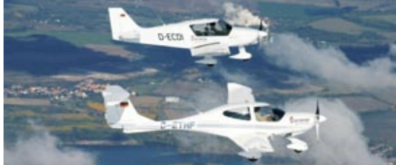
Le constructeur de moteurs pour l'aéronautique Thielert s'implante à Altenburg.