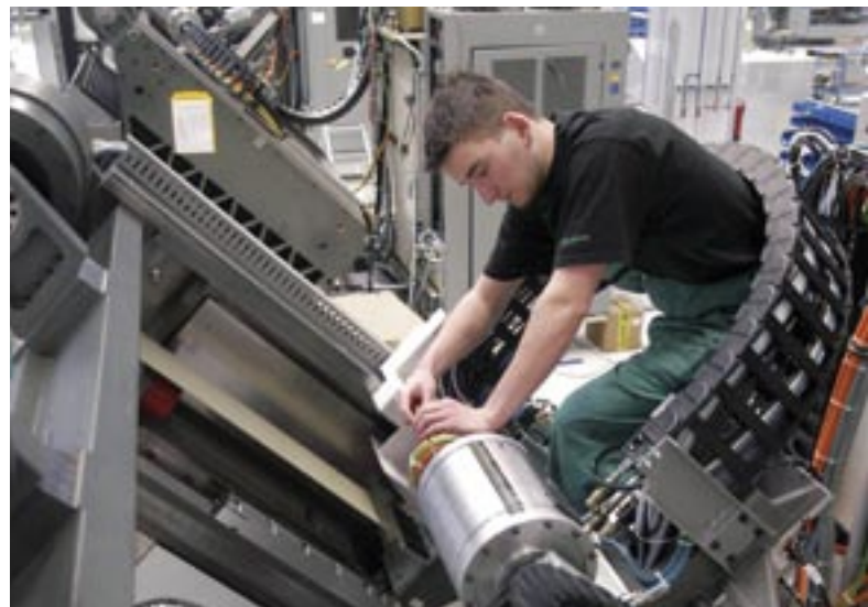
La filiale de Gildemeister, Deckel Maho Seebach compte parmi les entreprises innovantes de la construction mécanique thuringienne.

Un climat économique favorisant la création et l'innovation, des collaborateurs motivés et prêts à s'adapter, une infrastructure bien développée: c'est ce qui attend les entreprises de construction mécanique désireuses d'investir en Thuringe. Ce secteur est aujourd'hui déjà la 3 ème branche économique dans ce land en ce qui concerne le nombre d'emplois. Plus de 200 entreprises emploient plus de 15 000 personnes. Le taux d'exportations est passé en 2005 à 27,1 %; le chiffre d'affaires s'est élevé à 1,8 milliards d'euros. La tendance est à la hausse.