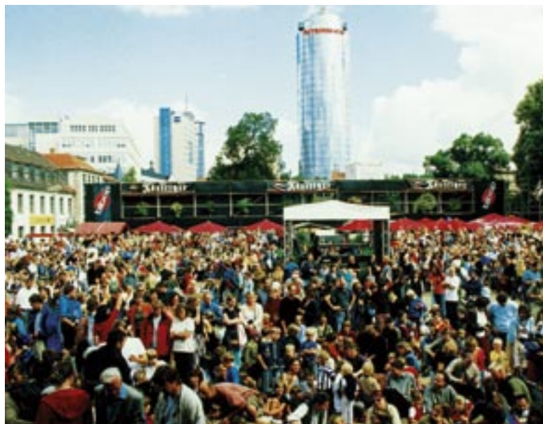
La Kulturarena attire des milliers de personnes à Jena pendant tout l'été.

Après un long hiver, l'été s'annonce riche en divertissements – en Thuringe au moins. Les fêtes se succèdent, et le choix s'annonce difficile entre les nombreux événements proposés dans ce land.