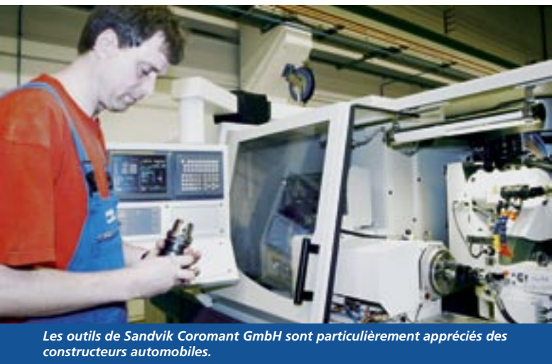
Les outils de Sandvik Coromant GmbH sont particulièrement appréciés des constructeurs automobiles.

C'est en Thuringe que Müller Weingarten AG a implanté la 3 ème plus grande usine de production de presses au monde. C'est là aussi que Deckel Maho Seebach GmbH, premier fabricant de machines-outils pour les nouveaux länder a créé sa filiale. C'est là enfin que le fabricant suédois d'outils Sandvik construit de nouvelles capacités de production. La Thuringe attire les entreprises de construction mécanique. D'autres entreprises telles que Jenoptik, Beyeler Maschinenbau GmbH ou Demag Ergotech GmbH connaissent depuis des années les points forts de cette région située au cœur de l'Allemagne. La Thuringe a une longue tradition dans le domaine de la construction de machines-outils spécialisées, dans la technique d'automatisation et dans la construction d'outils