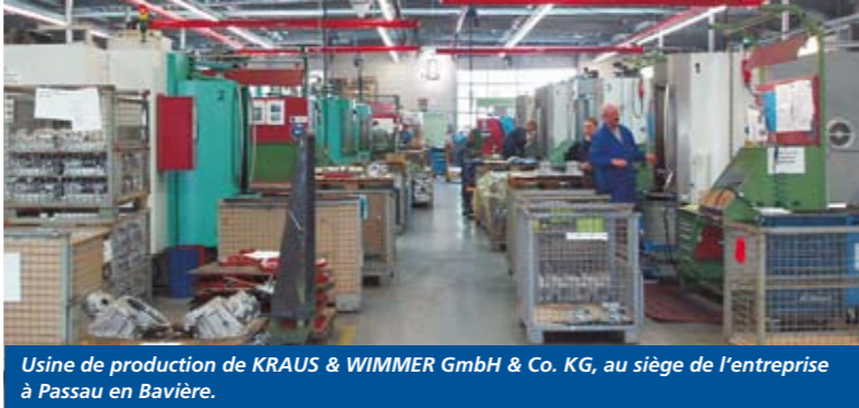
Usine de production de KRAUS & WIMMER GmbH & Co. KG, au siège de l'entreprise à Passau en Bavière.