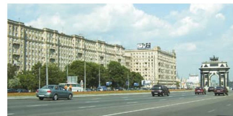
Le bâtiment qui abrite le bureau de représentation de la LEG (Société de Développement de la Thuringe) à Moscou.