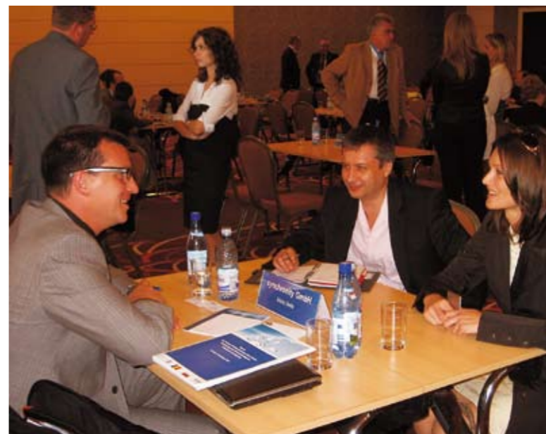
Lors du salon de la coopération qui a eu lieu à Sibiu (Roumanie) en automne 2007.

La Thuringe a désormais une adresse à Moscou, de même qu'à Dubaï (Emirats Arabes Unis), à Shaanxi en Chine et à Hanoi au Viêt-Nam. La Société de Développement de la Thuringe (LEG Thüringen) a ouvert des bureaux de représentation dans toutes ces villes, afin de permettre aux entreprises du Land d'accéder plus facilement aux marchés étrangers. L'an dernier a vu la création d'un bureau de représentation à Moscou, une initiative fort compréhensible quand on sait le formidable essor qu'ont connu les relations entre la Thuringe et la Fédération de Russie au cours des trois dernières années. Depuis l'année 2004, la Société de Développement de la Thuringe est aussi chargée de l'aide économique internationale. Elle prépare