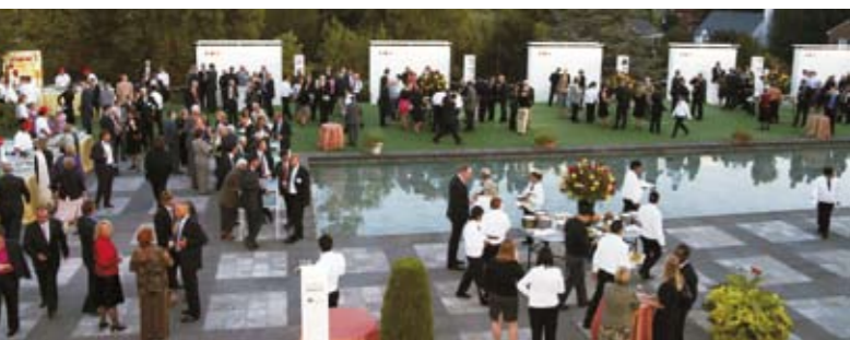
La Thuringe était présente le 3 octobre 2007 au „jardin des idées“ à Washington DC.

Un „jardin des idées“: c'est la contribution de la Thuringe lors de la Journée de l'Unité allemande célébrée à Washington DC. Cette manifestation, qui avait pour but de souligner les potentiels de la région dans le domaine de l'énergie solaire, a eu lieu à l'ambassade allemande le 3 octobre 2007, jour de la fête nationale allemande. En coopération avec d'autres