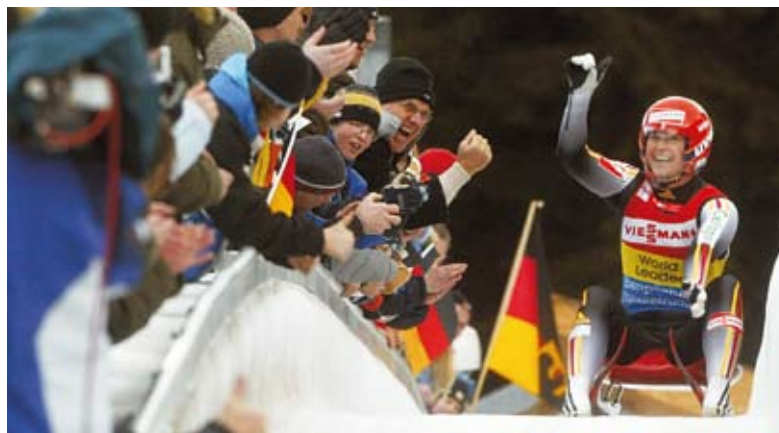
De l'émotion à l'état pur: c'est ce que promet le prochain championnat du monde de luge qui aura lieu à Oberhof.

La chanson de la coupe du monde s'appelle „Adrenaline“, la mascotte a été baptisée „Flocon“. C'est une région toute entière qui attend avec impatience le grand événement: la station de sports d'hiver d'Oberhof en Thuringe accueillera entre le 21 et le 27 janvier les championnats du monde de luge de course.