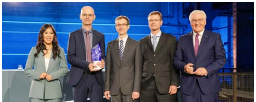
Ausgezeichnet: Die Forscher des Jenaer Unternehmens Carl Zeiss Microscopy erhalten den Deutschen Zukunftspreis 2022.

hen – in der Grundlagenforschung und bei der Suche nach neuen Diagnoseverfahren oder Wirkstoffen gegen viele Erkrankungen. Auch dank dieser neuen Entwicklungen macht Jena erneut seinem Namen als Hightech-Standort der optischen Industrie alle Ehre. (gro)