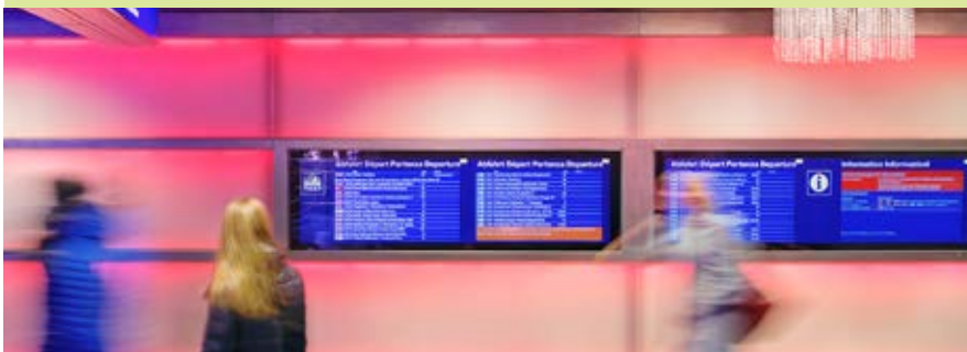
Auch bei der Schweizerischen Bundesbahn in Zürich werden die Anzeigetafeln aus Kölleda verwendet.

gerüstet sind, über Zugfunkgeräte des Unternehmens Kontakt zu ihren Leitstellen. Dies ist ein Beispiel für die hohen Marktanteile, welche die Funkwerk AG in wichtigen Segmenten hält. Seit über 70 Jahren produziert Funkwerk in Kölleda elektronische Geräte. Der heutige unternehmerische Erfolg fußt also auf einer langen Tradition, wobei man über die Jahrzehnte immer zukunftsorientiert dachte und arbeitete. So auch momentan: Angesichts verstärkter staatlicher und privater Maßnahmen zum Schutz der sogenannten kritischen Infrastruktur entwickelt die Funkwerk AG beispielsweise Systemlösungen im Bereich Cyber Security, um die Nachfrage zu bedienen. (hw)