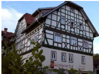
Das geschichtsträchtige Gebäude wurde aufwändig saniert.

Thüringen bietet zauberhafte Naturlandschaften und attraktive Angebote in Gastronomie und Hotellerie – ein Beispiel stellt der „Saxenhof“ im Südwesten des Freistaats dar. In dem Traditionshaus ließen sich schon der österreichische Kaiser Franz I., der Dichter Ernest Hemingway und der DDR-Politiker Günter Schabowski verwöhnen. Die Prominenz zog es in die landschaftlich reizvolle Rhön, von vielen als „Deutschlands schönstes Mittelgebirge“ bezeichnet.