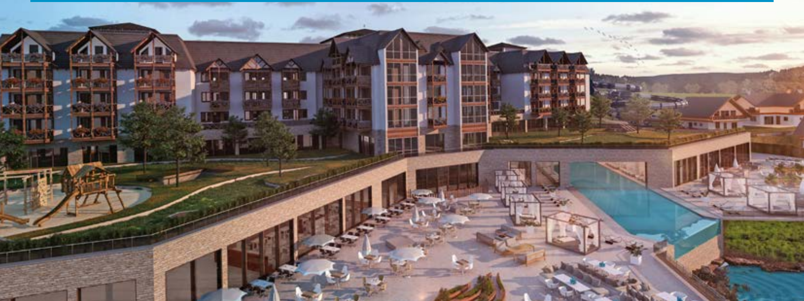
Das neue Familux Resort „The Grand Green“ in Oberhof/Thüringer Wald bietet Traumurlaub für Familien.