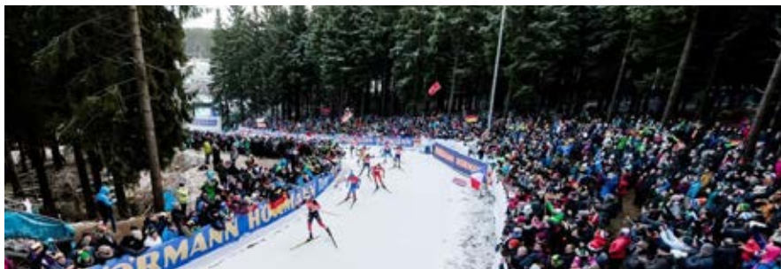
Die Wintersportwettkämpfe in Oberhof sind immer ein Publikumsmagnet.

www.oberhof23.de www.thueringen-entdecken/drausspowern.de